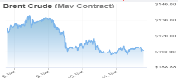
ภาพ: ราคาสัญญาซื้อขายล่วงหน้าเดือน พ.ค. 65 ของน้ำมันดิบเบรินท์ ที่มา: Oilprice

ที่มา: ไทยออยล์ ↑ เพิ่มขึ้นเมื่อเทียบกับสัปดาห์ก่อน ↓ ลดลงเมื่อเทียบกับสัปดาห์ก่อน