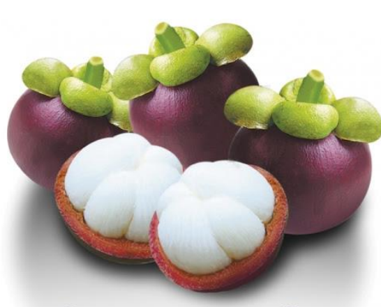
ภาพที่ 1 มังคุดราชินีผลไม้ไทย

ไทยเป็นผู้ผลิตและผู้ส่งออกมังคุดรายใหญ่ของโลก โดยมีการส่งออกมังคุดปี 2562 ปริมาณ 409,255 ตัน มูลค่า 16,727.14 ล้านบาท แบ่งออกเป็น มังคุดสด ปริมาณ 409,011 ตัน มูลค่า 16,703 ล้านบาท และ มังคุดแช่แข็ง ปริมาณ 244 ตัน มูลค่า 23.94 ล้านบาท ทั้งนี้ ความต้องการมังคุดของตลาดโลกยังคงมีแนวโน้มเพิ่มขึ้นและขยายตัวอย่างต่อเนื่องหากผลผลิตได้ผ่านการรับรองมาตรฐานการปฏิบัติทางการเกษตรที่ดี