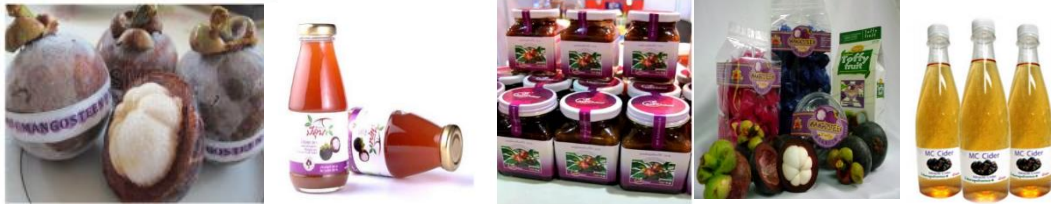
ภาพที่ 5 ผลิตภัณฑ์แปรรูปจากมังคุด

6) มังคุดไซเดอร์ มีลักษณะคล้ายแอปเปิ้ลไซเดอร์ เป็นเครื่องดื่มผลไม้ที่มีแอลกอฮอล์ต่ำ เพื่อทดแทนเครื่องดื่มที่มีแอลกอฮอล์สูง เป็นประโยชน์ต่อสุขภาพ อีกทั้งน้ำมังคุดไซเดอร์ ยังมีคุณค่าทางโภชนาการสูง เช่น โปแทสเซียมสูงถึง 871 มิลลิกรัมต่อลิตร