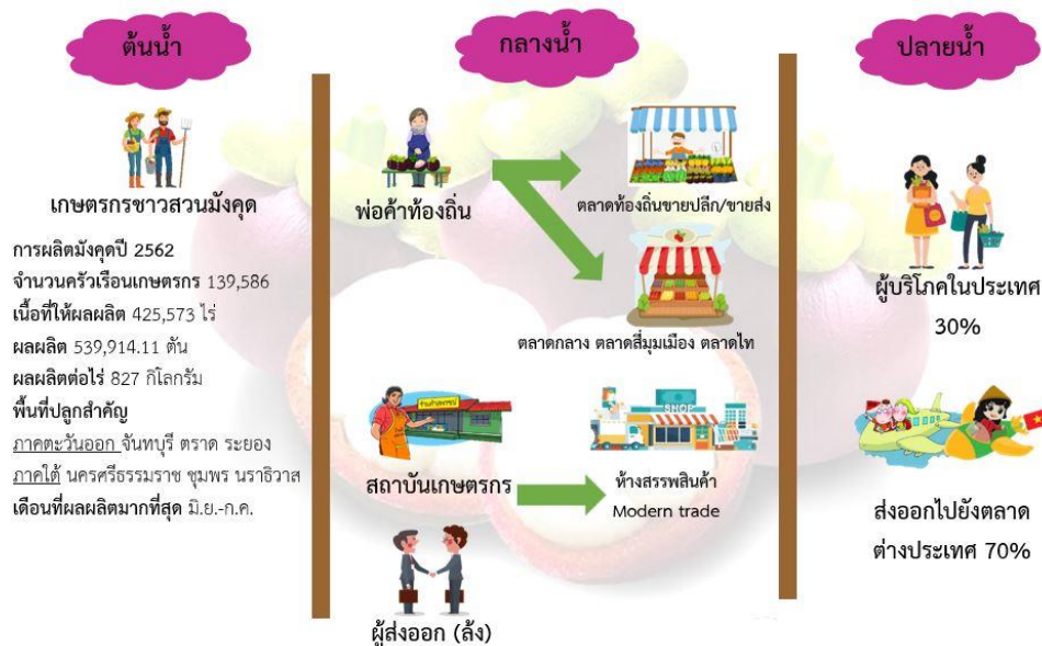
ภาพที่ 4 ห่วงโซ่สินค้ามังคุด

โครงสร้างสินค้ามังคุด ประกอบไปด้วย ต้นน้ำ คือ เกษตรกรชาวสวนมังคุด ในปีการผลิต 2562 จำนวนครัวเรือนเกษตรกร 139,586 ครัวเรือน เนื้อที่ให้ผลผลิต 425,573 ไร่ ผลผลิต 539,914.11 ตัน ผลผลิตต่อไร่ 827 กิโลกรัม พื้นที่ปลูกมังคุดที่สำคัญ ได้แก่ จันทบุรี ตราด ระยอง นครศรีธรรมราช ชุมพร และนราธิวาส เดือนที่มังคุดออกผลผลิตจำนวนมากช่วงเดือนมิถุนายนถึงกรกฎาคมของทุกปี