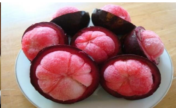
ภาพที่ 2 มังคุดสดและมังคุดแช่แข็งเพื่อการส่งออก

มังคุดสด ในปี 2563 (ม.ค.-มี.ค.) ปริมาณการส่งออก 5,465 ตัน มูลค่า 255.38 ล้านบาท ลดลงจากปี 2562 ในช่วงเดียวกัน ที่มีปริมาณการส่งออก 52,350 ตัน มูลค่า 1,939.17 ล้านบาท หรือลดลงร้อยละ 86.83