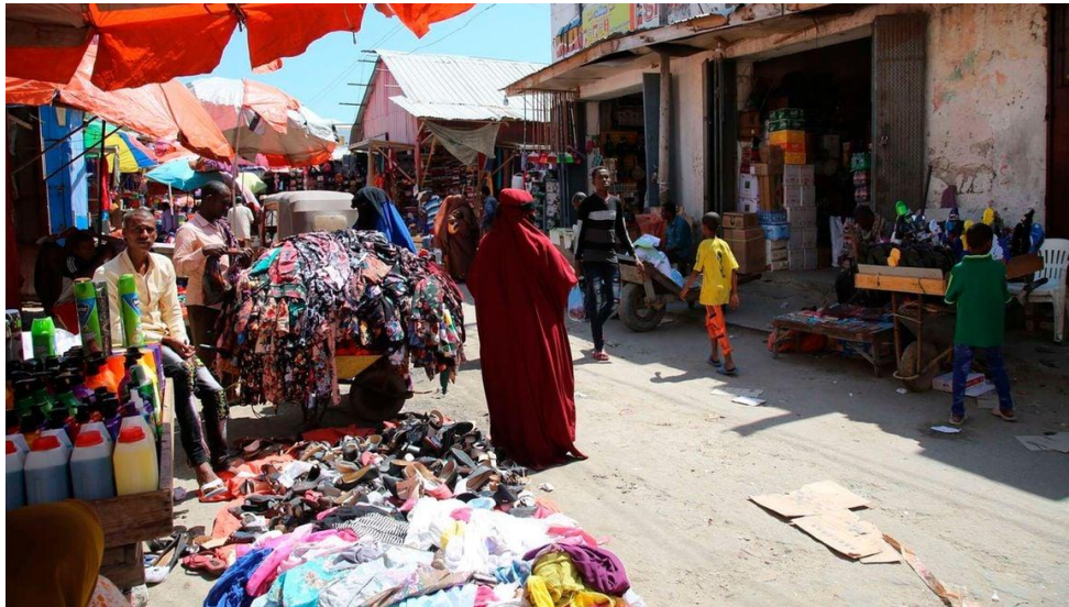
ภาพ: ผู้ค้าขายสินค้าแผงลอยตามถนนในประเทศโซมาเลีย

ประเทศโซมาเลียมีสิทธิที่จะได้รับการพิจารณาอนุมัติการผ่อนปรนหนี้ทั้งหมดจากกองทุนการเงินระหว่างประเทศ หรือ IMF รวมถึงหนี้กับผู้ให้กู้รายอื่นๆ ภายในสิ้นปีนี้ เนื่องจากการปฏิบัติตามคำแนะนำในการปฏิรูประบบภาษีเพื่อเพิ่มการจัดเก็บรายได้ของประเทศและความโปร่งใสทางการเงินการคลังของประเทศเริ่มเห็นผลอย่างชัดเจน ซึ่งถือเป็นจุดเปลี่ยนที่ทำให้ทาง IMF ตัดสินใจสำหรับที่จะพิจารณาอนุมัติให้โซมาเลียได้รับการผ่อนปรนหนี้ที่โซมาเลียได้รับจากประเภทเงินกู้ที่ให้กับประเทศยากจนที่มีหนี้สินสูง (Heavily Indebted Poor Countries - HIPC) ซึ่งจะทำการหนี้ลดลงเหลือเป็น ๓.๗ พันล้านเหรียญสหรัฐ จาก ๕.๒ พันล้านเหรียญสหรัฐ จากยอดหนี้สะสมเดิม และการผ่อนปรนหนี้ครั้งนี้จะช่วยลดภาระหนี้สินของโซมาเลียให้เหลือ ๕๕๗ ล้านดอลลาร์สหรัฐ หรือประมาณร้อยละ ๑๐ ของผลิตภัณฑ์มวลรวมในประเทศ (GDP) ทำให้สามารถจัดการกับผลกระทบหลายอย่างซึ่งส่งผลต่อการเติบโตและการพัฒนาทางเศรษฐกิจของประเทศได้มากขึ้น