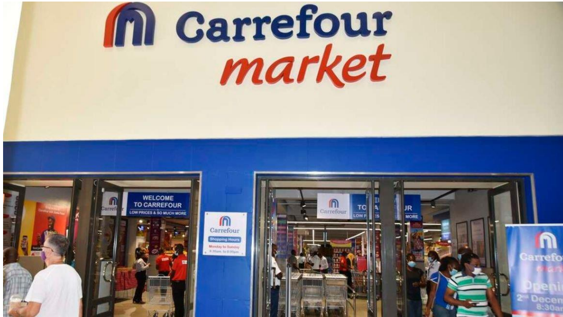
ภาพ: ห้าง Carrefour สาขาหนึ่งในกรุงไนโรบี ประเทศเคนยา

ห้าง Carrefour ประกาศให้กลุ่มเกษตรกรและฟาร์มเลี้ยงไก่ในประเทศเคนยาทราบว่า นโยบายในการจัดซื้อของบริษัทที่รับนโยบายมาจากสำนักงานใหญ่ในดูไบ (Carrefour's parent firm, Dubai-based Majid Al Futtaim) ว่า ต่อจากนี้ ห้างจะรับซื้อฟาร์มไข่ที่เลี้ยงในแบบ Cage Free Eggs หรือ การเลี้ยงแบบไข่ไก่ที่มาจากแม่ไก่ที่เลี้ยงแบบธรรมชาติ ที่เป็นที่รู้จักในประเทศไทยและประเทศพัฒนาแล้วหลายประเทศ ในอันที่จะทำให้เกิดสวัสดิภาพต่อสัตว์ ซึ่งแสดงให้เห็นว่า เกษตรกรในเคนยาที่ยังไม่ปฏิบัติตามวิธีการเลี้ยงนี้ จะต้องปรับตัวและปรับปรุงการเลี้ยงให้มีคุณภาพและมาตรฐานมากขึ้น ไมเช่นนั้นก็จะไม่สามารถเข้ามาขายได้ ซึ่งเป็นกลยุทธ์การสร้างภาพลักษณ์ที่ใส่ใจต่อผู้บริโภคอย่างหนึ่งของห้าง Carrefour ในตลาดเคนยา