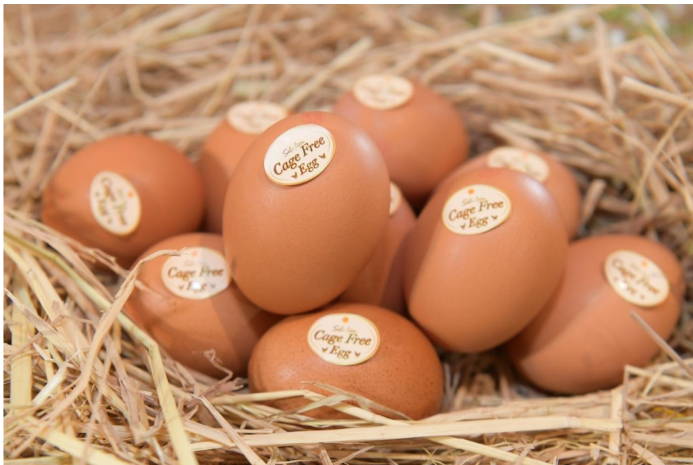
ภาพ: ไข่ไก่ที่ได้มาตรฐานการเลี้ยงแบบ Cage Free EGG ในประเทศไทย

ด้วยเหตุนี้ ไข่ไก่ Cage Free Egg จึงมีสารอาหารที่เป็นประโยชน์ต่อร่างกาย ประกอบด้วย โปรตีนสูง ซึ่งโปรตีนจะช่วยเสริมสร้างการเจริญเติบโต การสร้างกล้ามเนื้อ ซ่อมแซมส่วนที่สึกหรอ มีวิตามิน A ช่วยเพิ่มความชุ่มชื้นให้ผิวหนัง และบำรุงสายตา ช่วยในการมองเห็น วิตามิน B1 เสริมสร้างการเจริญเติบโตของร่างกาย บำรุงสมอง กล้ามเนื้อ และวิตามิน B2 ช่วยเพิ่มประสิทธิภาพในการมองเห็น บรรเทาอาการอ่อนล้าของสายตา บำรุงผิวพรรณ เล็บ และเส้นผม นอกจากนี้ ยังมีความสดกว่าไข่ไก่ทั่วไป และไม่มีกลิ่นคาว