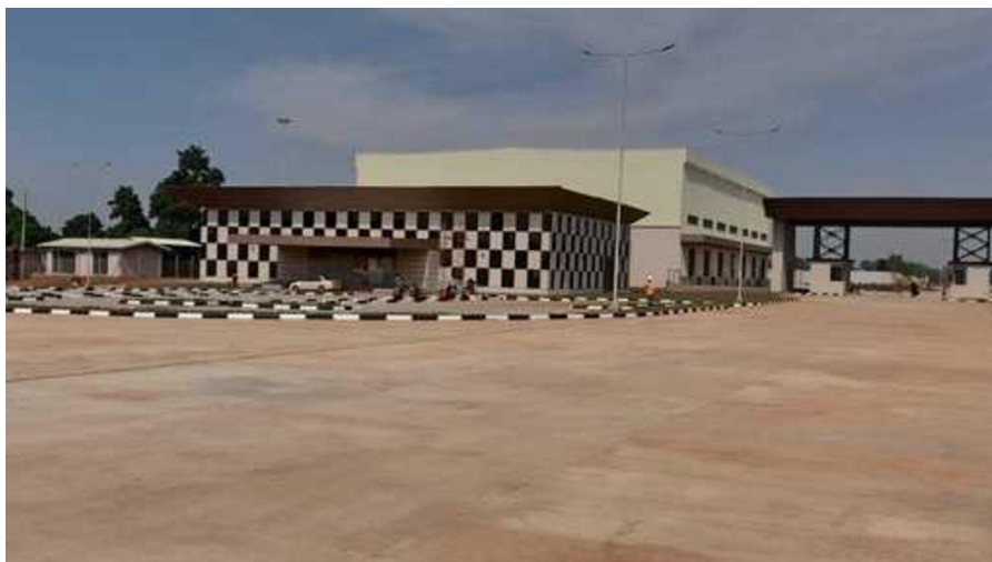
ภาพ: ศูนย์กลางโลจิสติกส์ The Gulu พร้อมเปิดให้บริการในปี 2022 แล้ว

เป็นเวลากว่าทศวรรษแล้วที่พื้นที่เมือง Gulu ทางตอนเหนือของประเทศยูกันดาได้ถูกจำกัดเป็นเขตพื้นที่หวงห้าม เนื่องจากเป็นพื้นที่ในการสู้รบระหว่างกองทัพยูกันดาและกลุ่มกบฏ อย่างไรก็ตาม ประโยชน์อย่างหนึ่งที่กลุ่มกบฏ Lord's Resistance Army นำโดยนาย โจเซฟ โคนี (Joseph Kony) ซึ่งต่อสู้กับรัฐบาลในขณะนั้นได้ทิ้งไว้ให้กับ ยูกันดา ปัจจุบันเมืองนี้มีการพัฒนาขึ้นจากซากปรักหักพังเมื่อครั้งที่พื้นที่แถบนี้ยังคงเป็นสมรภูมิรบระหว่าง ฝายรัฐบาลยูกันดาและกองกำลังดังกล่าวข้างต้น และได้กลายมาเป็นจุดศูนย์กลางธุรกิจระหว่าง 3 ประเทศ คือ ยูกันดา ประเทศซูดานใต้ และประเทศสาธารณรัฐประชาธิปไตยคองโก ในแอฟริกาตะวันออก