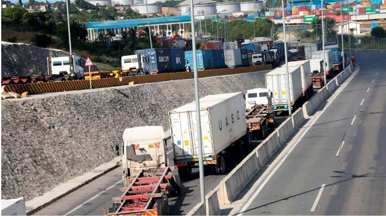
ภาพ: รถบรรทุกสินค้าเข้าคิวที่ทางเข้าหลักของ Kenya Ports Authority ใน Mombasa ขณะนี้ผู้นำเข้าสินค้ารายย่อยจะต้องชำระภาษีตามมูลค่าธุรกรรมตามคำสั่งใหม่โดย KRA

ผู้นำเข้าสินค้ารวมตู้รายย่อย (Consolidated good Importers) จะต้องชำระภาษีตามมูลค่าธุรกรรม ตามคำสั่งใหม่ของ Kenya Revenue Authority (KRA) ส่งผลกระทบเพิ่มเติมทุนในการดำเนินธุรกิจและราคาขายปลีกในสินค้านำเข้ากับผู้บริโภค ระเบียบใหม่ของกรมสรรพากรที่วางนี้ กล่าวโดยสรุปคือ สินค้าที่มีการนำเข้าโดยผู้นำเข้ารายย่อยที่รวมเข้าเป็นตู้มาในเคนยา เช่น เสื้อผ้ามือสองและของใช้ในครัวเรือนมือสอง เป็นต้น จะต้องมีการเสียภาษีตามมูลค่าที่มีการนำเข้าในแต่ละราย จากเดิมที่เคย สามารถตกลงเหมาจ่ายเป็นตู้ได้ โดยสินค้านี้มือสองเหล่านี้ เป็นสินค้าที่จะนิยมในการวางขายในตลาดสินค้ามือสองในกรุงไนโรบี เช่น Gikomba และ Nyamakima ทำให้ พวกผู้นำเข้ารายย่อยเหล่านี้ จะถูกเรียกเก็บภาษีนำเข้า ภาษีมูลค่าเพิ่ม (VAT) ภาษีสรรพสามิต และภาษีนำเข้า (Import Declaration Levy) และค่าธรรมเนียมรถไฟ เช่นเดียวกับผู้นำเข้าสินค้าเต็มตู้ตามปกติ