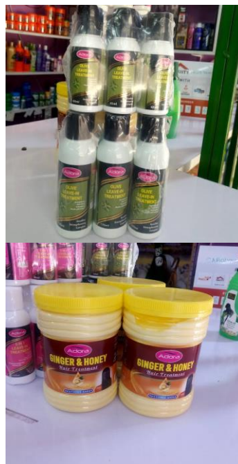
ตัวอย่างสินค้าที่มีจำหน่ายของบริษัทในประเทศเคนยา