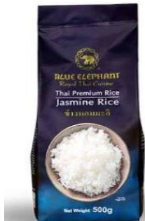
1 אורז ימיין לבן 1 ג'ק BLUE ELEPHANT ฿18.90 การมา