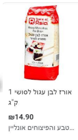
1 אורז לבן עגול 100% ג'ק ฿14.90 טבע והפיקוחים אונליין...