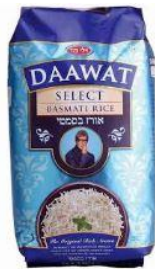
1 אורז בסמטי משוכה 1 ג'ק - DAAWAT ฿14.90 การมา

การจัดจำหน่ายข้าวในอิสราเอลนั้น นิยมข้าวในแบบบรรจุถุงขนาด 500 กรัม และ 1 กิโลกรัม และ 5 กิโลกรัม มีจำหน่ายในซูเปอร์มาร์เก็ตทั่วไป และร้านขายปลีกที่กระจายอยู่ตามชุมชนเกษตรที่มีแรงงานคนไทย เป็นลูกค้า ราคาเฉลี่ย กิโลกรัม 12 เซกเกิล (1เซกเกิล ประมาณ 10 บาท)