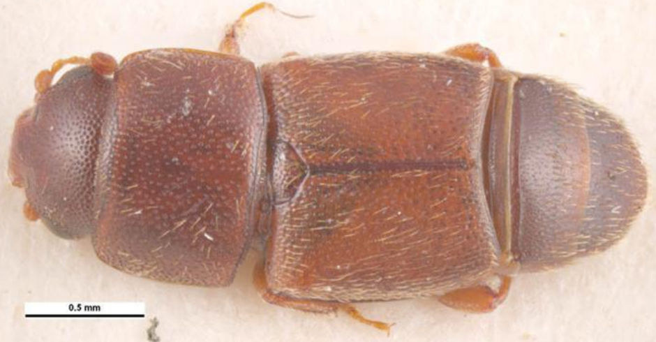
ด้วงผลไม้แห้ง Carpophilus mutilatus