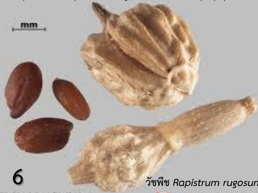
วัชพืช Rapistrum rugosum