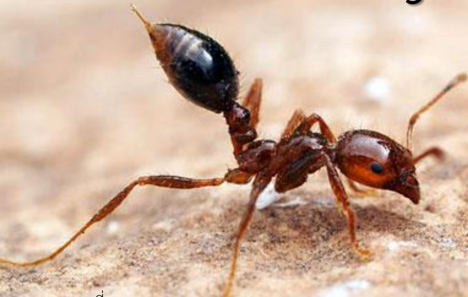
มดคันไฟอินวิคต้า Solenopsis invicta