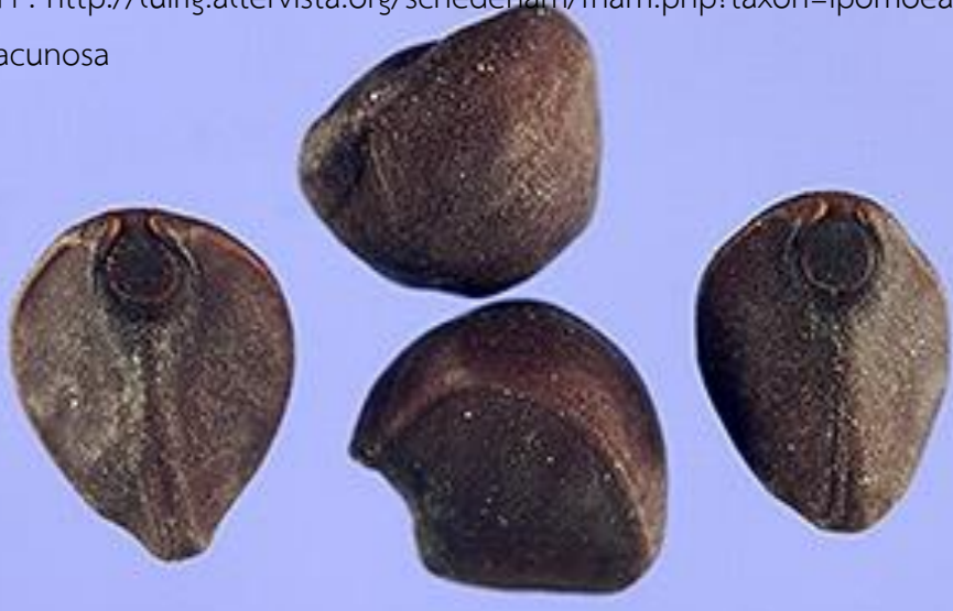
วัชพืช Ipomoea lacunose