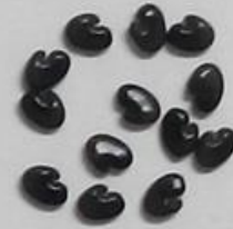
รางจืดต้น Crotalaria spectabilis